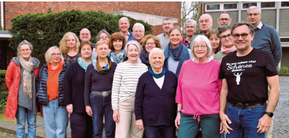
Am 25. Februar 1961, also vor 65 Jahren, wurde der Johannes-Chor gegründet.